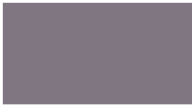
DIC-N931 灰紫(はいむらさき)