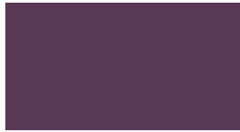
DIC-N928 桑の実色(くわのみ)