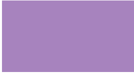
DIC-N906 藤紫(ふじむらさき)